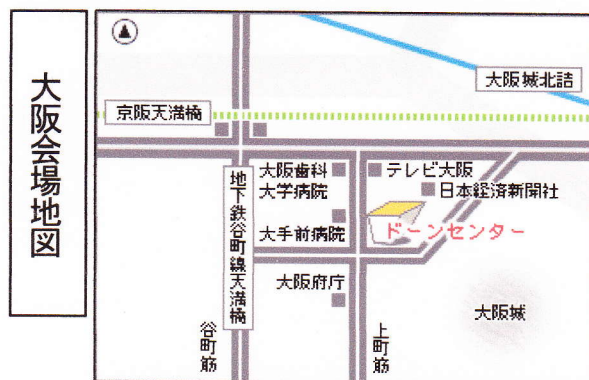
●京阪天満橋駅・地下鉄谷町線天満橋駅 1番出口から東へ350m