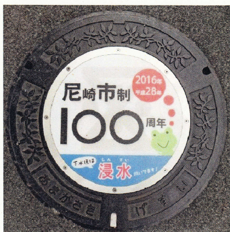
デザインマンホール

昨年度は試験的に市役所西側歩道部において2箇所設置しておりましたが、今回新たに市内複数の駅前に10箇所設置いたしました。