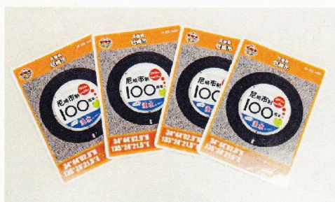
マンホールカード