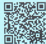
クレオ大阪 講座申込システム (講座名を入力してください)