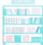
情報ライブラリー