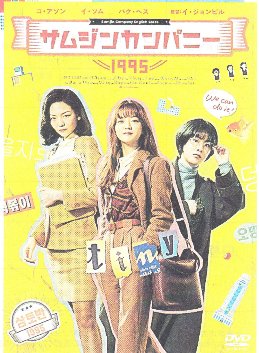
(C) 2020 LOTTE ENTERTAINMENT & THE LAMP All Rights Reserved.

国際化のため激変する90年代のソウルが舞台。大企業に勤める3人の高卒女性社員たちが、露骨な学歴差別のなかで、会社の不正に立ち向かっていく姿を痛快に描いたコメディドラマ。(2020年/110分/韓国)